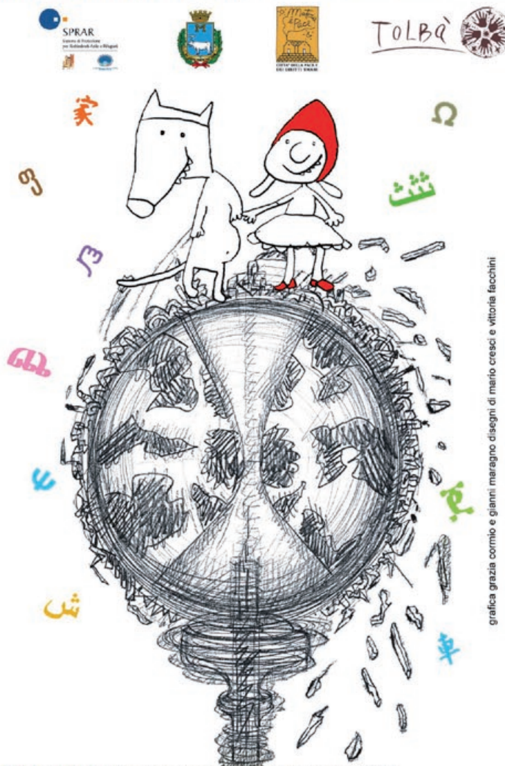
grafica grazia cormio e gianni maragnò disegni di mario cresci e vittoria facchini

tutto il convegno sarà trasmesso on line sul sito www.ilmiotg.com