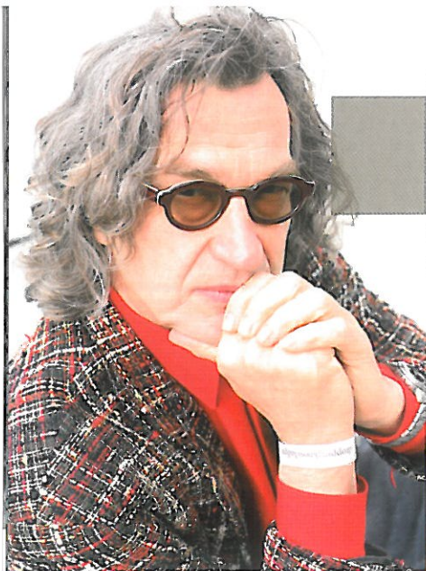
Wim Wenders

Un fine settimana intenso e divertente studiato per aiutare i partecipanti ad aumentare la propria capacità di interagire con il soggetto ed a comporre le immagini con intuizione e rapidità. Un percorso didattico decisamente non convenzionale che allena la sensibilità del fotografo e la sua capacità di completare agilmente tutte le fasi necessarie per realizzare un ritratto.