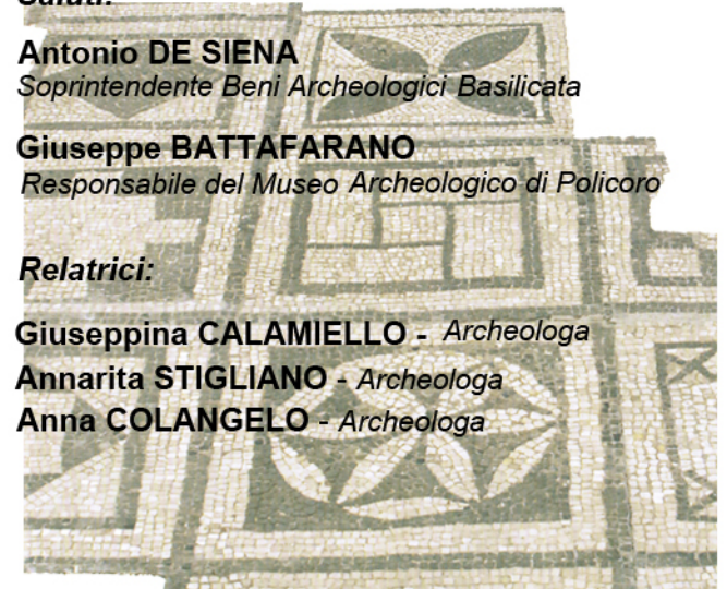
Nova Siri. Impianto termale di Ciglio dei Vagni. Particolare mosaico