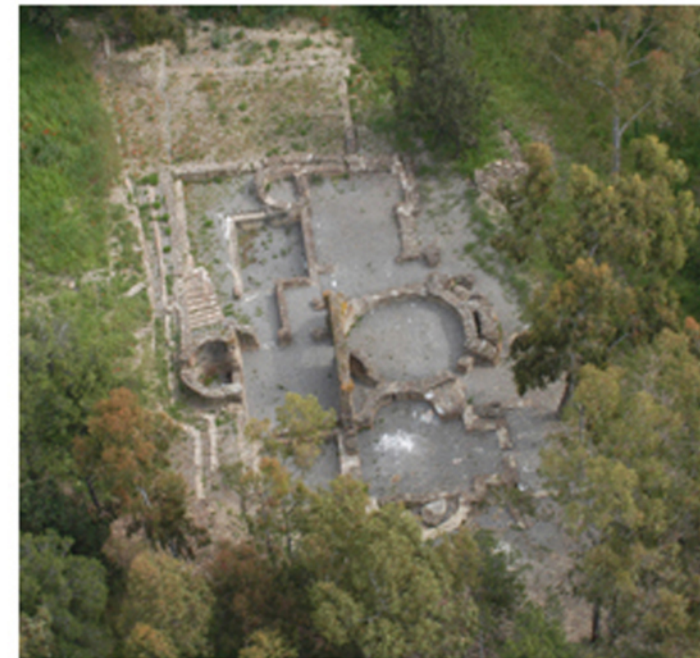
NOVA SIRI. Impianto temale di Ciglio dei Vagni